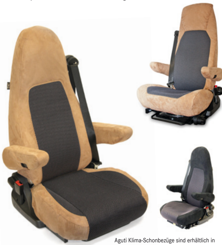
Aguti Klima-Schonbezüge sind erhältlich in sand/grau und anthrazit/grau (Abbildungen können vom Original abweichen)

Aufgrund seiner hervorragenden Eigenschaften wird 3D-Gewirke nicht nur im medizinischen Bereich und bei modernen Matratzen, sondern auch in Oberklasse-Fahrzeugen und bei Luxusyachten verwendet.